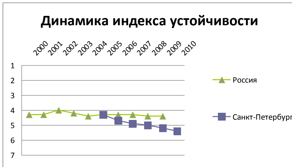
Рис. 1. Динамика показателей индекса устойчивости НКО Санкт-Петербурга и России

На рис. 2 приведены частные показатели Индекса устойчивости НКО России за 2009 год и Санкт-Петербурга за 2009 и 2010 годы.